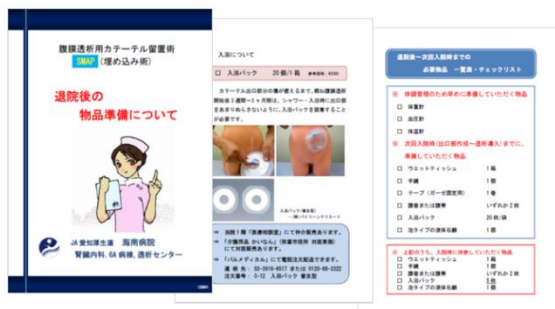
オリジナル患者指導用資材の作成

PD指導は、外来(血液浄化センター)と病棟看護師が連携をとり、オリジナルのパンフレットやDVDを使用し、患者の個別性に応じた教育をおこなっています。